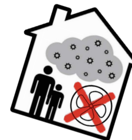
Défaut de ventilation