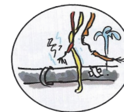
Les canalisations d'eau et gaz sont en mauvais état