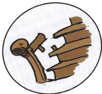
Rampe ou marche d'escalier détériorée