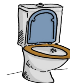
absence de sanitaire