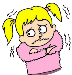
Chauffage absent ou insuffisant