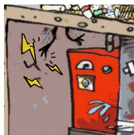
Installation dangereuse d'électricité ou de chauffage