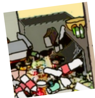
Accumulation de déchets