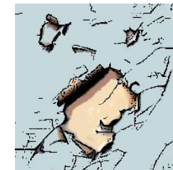
Présence de peintures au plomb (habitation avant le 01/01/1949)