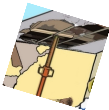
Risque d'effondrement intérieur, extérieur ou dans les parties communes de chute de matériaux