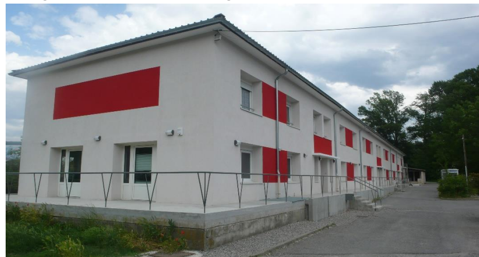
Résidence sociale et Pension de Famille le Tamaris à Gap.