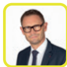
Stéphane Beaudet Maire d'Évry-Courcouronnes